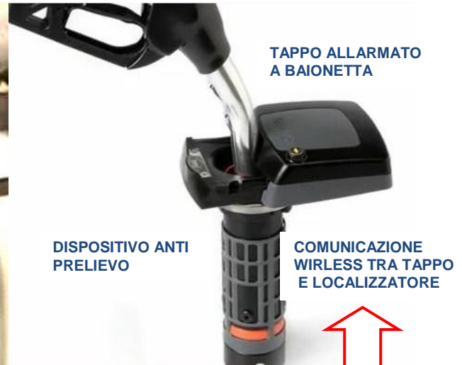
Sistema di rifornimento e montaggio